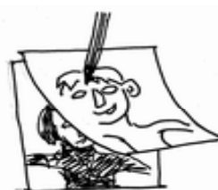
トレーシングペーパーで写す

あまり白が多くなりすぎないように！（黒が6～7割ぐらいあった方がよい） 木版画（単色）は、白い部分・黒い部分をよく考えるよう指導しよう