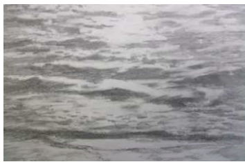
海の下絵をもとに