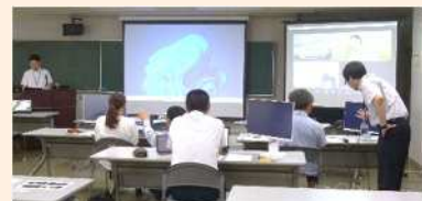
「児童生徒が自ら考える力を高める！ 情報モラル教育実践講座」の様子(9月12日)